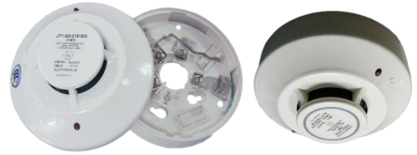
JTY-GD-2151EIS & DZ-B401

防爆标示Exib II C T6 Gb，适用于工厂内具有II A~II C级的可燃性气体存在的危险环境。