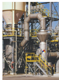
35 MM BTU / 小时顶烧式系统