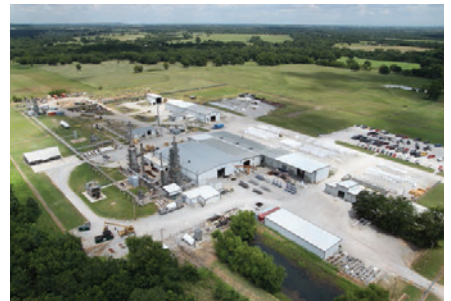
霍尼韦尔凯勒特在美国占地82,000平方英尺的生产制造基地