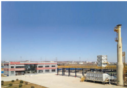
霍尼韦尔UOP凯勒特的燃烧测试中心 - 中国