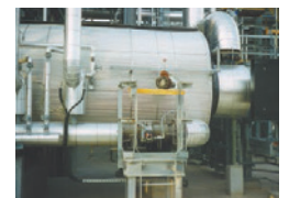
20 MM BTU / 小时硫装置尾气焚烧炉