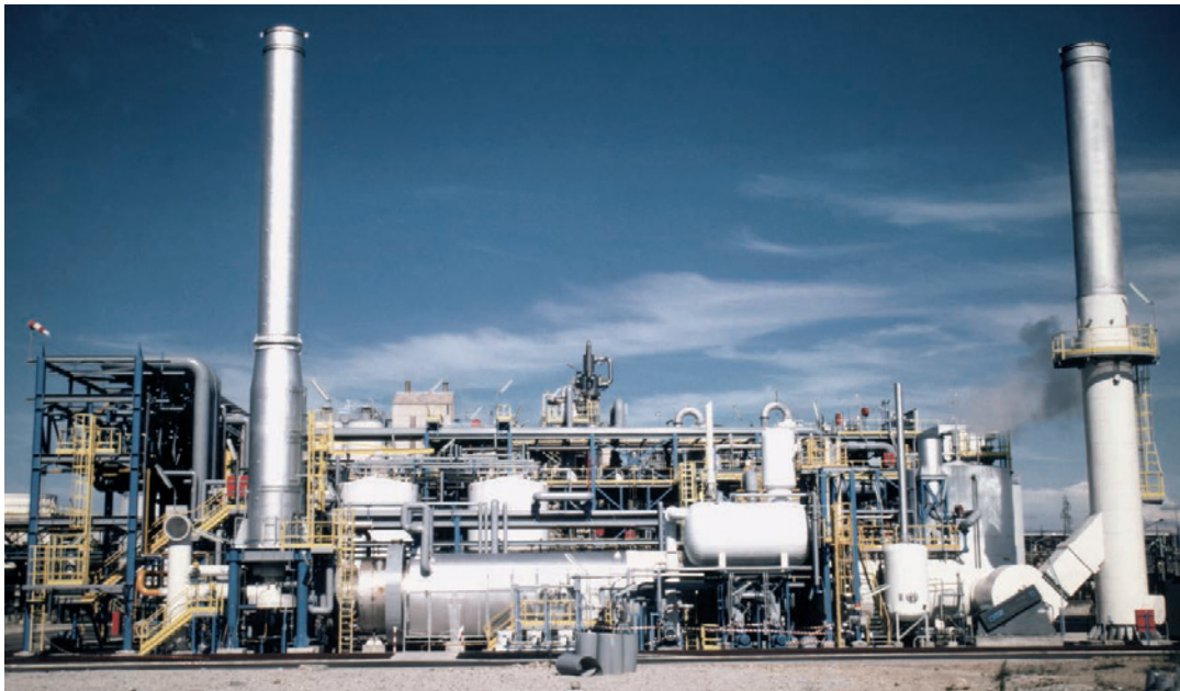
80 MM BTU/小时低 NOx 系统