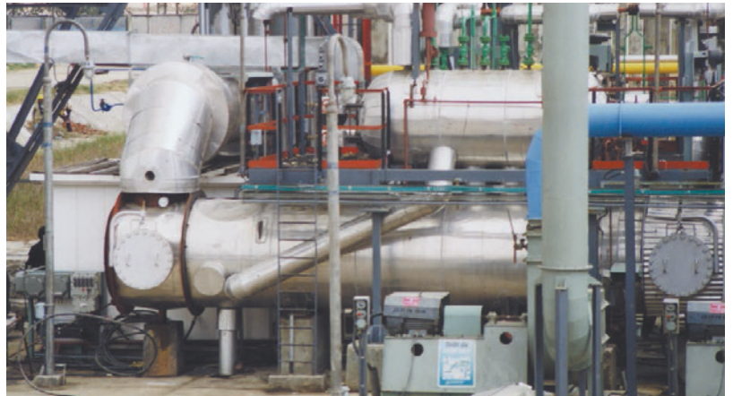
deNOxidizer / 尾气装置