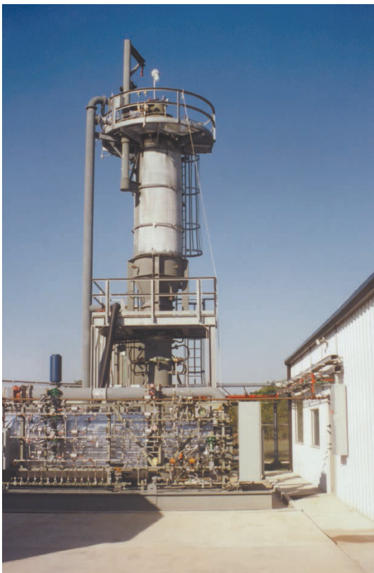
霍尼韦尔 UOP 凯勒特研发测试中心的顶烧式氧化炉