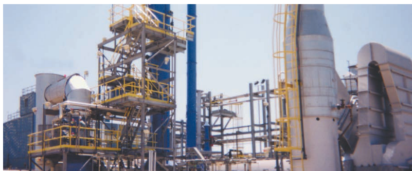
8 MM BTU / 小时溴化废弃物

作为热氧化炉市场中的全球领导者，我们的许多制造工艺都在全球范围内实现了本地化，但是核心专利部件全部由凯勒特美国工厂负责制造供货。这样可以促进良好的经济增长和效益，并为客户提供具有最优性价比的燃烧系统。