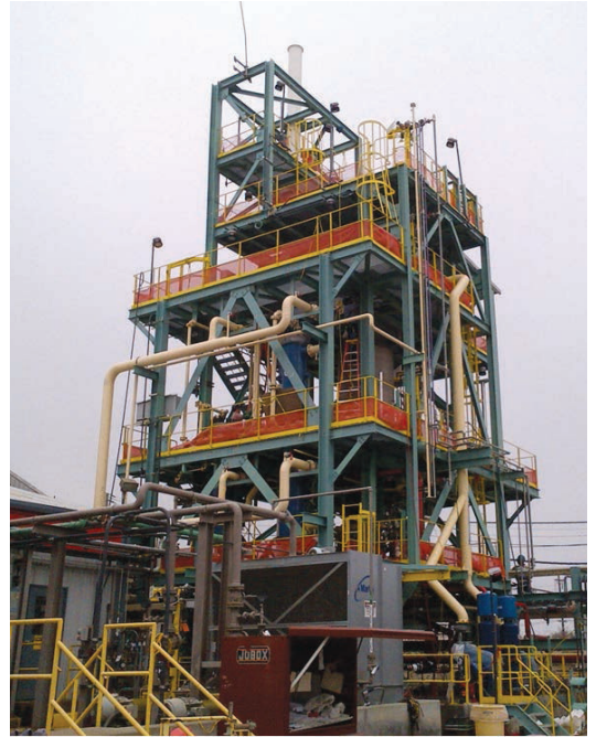
含卤废弃物热氧化炉