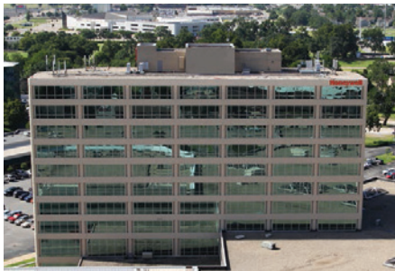
霍尼韦尔UOP凯勒特总部 - 美国俄克拉荷马州塔尔萨