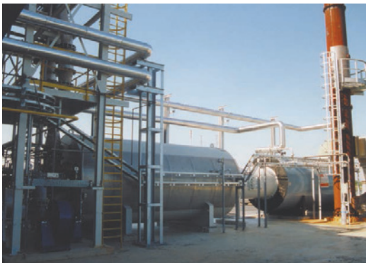
15 MM BTU / 小时烟气焚烧炉