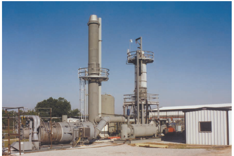
霍尼韦尔 UOP 凯勒特研发测试中心的三级燃烧系统

最后第三级，在过氧条件下，废气在 1700°F - 2000°F 之间发生氧化反应，从而完成整个燃烧过程。最终所排出烟气的 NOx 含量约为 80 到 200 ppm（主要取决于废弃物组分）。对于大多数废弃物成分，该系统的去除率可以达到 99.99%。