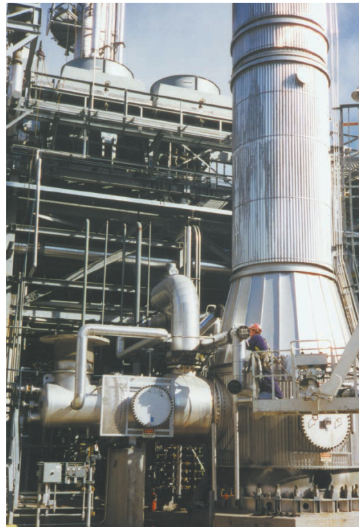
22 MM BTU / 小时尾气装置