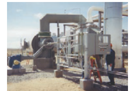
9.5 MM BTU / 小时烟气焚烧炉